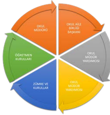
Tablo 6. Paydaş Döngüsü

Millî Eğitim Bakanlığı, Kaymakamlık, İlçe Milli Eğitim Müdürlükleri, Okullar, Yöneticiler, Öğretmenler, Özel Öğretim Kurumları, Öğrenciler, Okul aile birlikleri, Memur ve Hizmetli, Belediye, İl Sağlık Müdürlüğü, Meslek odaları, Sendikalar, Vakıflar, Muhtarlıklar, Tarım İlçe Müdürlüğü, Sivil Savunma İl Müdürlüğü, Türk Telekom İlçe Müdürlüğü, Medya vb.